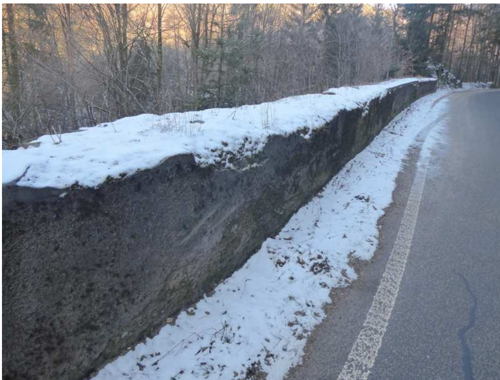
V koruně betonové zídky, která ze strany silnice lemuje tu kamennou, bude realizována oprava poškozené betonové římsy.