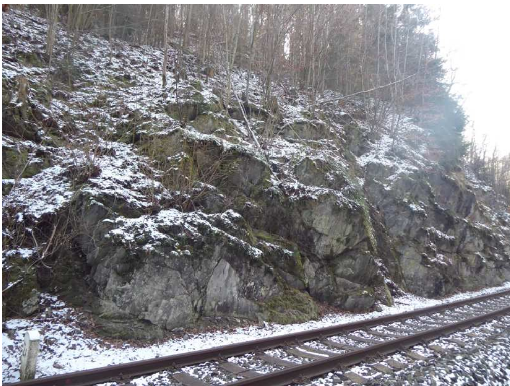
Po odstranění vegetace, očištění a odtěžení akumulčního prostoru bude skal. svah zajištěn ocel. sítí 80 x 100 mm. Stávající vedení IS bude zachováno.