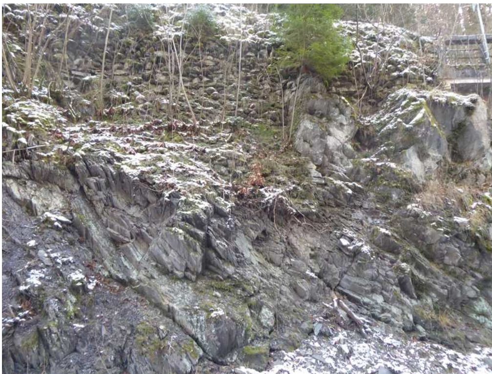
V patě skal. stěny bude realizována kotvená kamenná podezdívka a stávající kamenná zídka bude po očištění lokálně opravena místním, vytěž. kamenem.