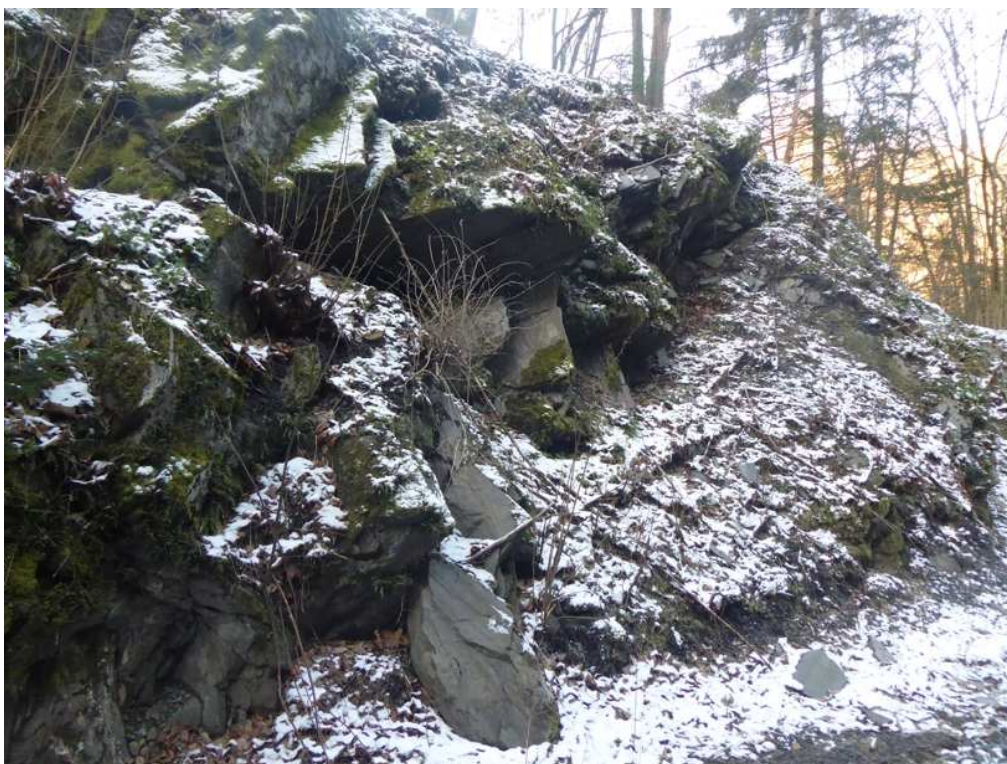
Stávající vzniklé převisy, kaverny a nestabilní bloky budou sanovány pomocí kotvených kamenných podezdívek z místního, vytěženého kamene.